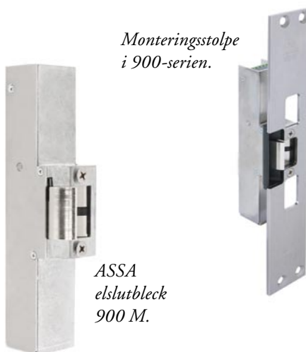
Monteringsstolpe i 900-serien.

Hålbilden för infästning av elslutblecket mot monteringsstolpen är alltså lika för alla modeller inom 900-serien. En nyhet är att modellerna 910, 911, 920 klarar att öppna även vid listtryck och att 920 är brandklassad.