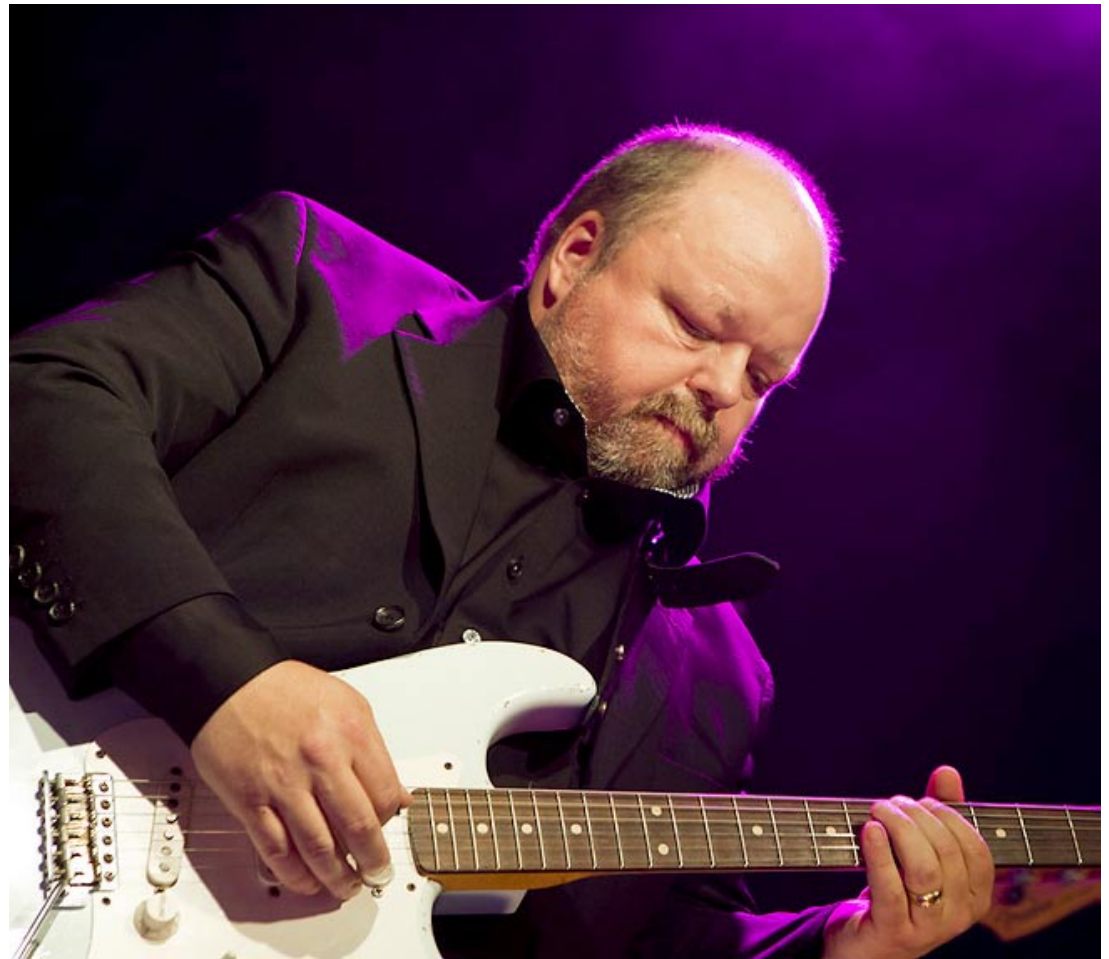
Kalle Moraeus' uppskattade uppträdande i samband med Göthes 150-årsfest.

Ett annat viktigt resultat av vänskapen mellan Kalle Moraeus och Håkan Östlund, är att han blivit ambassadör för Barndiabetesfonden.