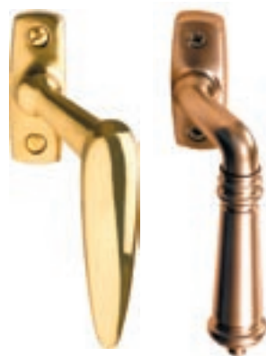
Two examples of window handles that belong to the new Epok series.

Handtagen i Epok-serien finns på Göthes.