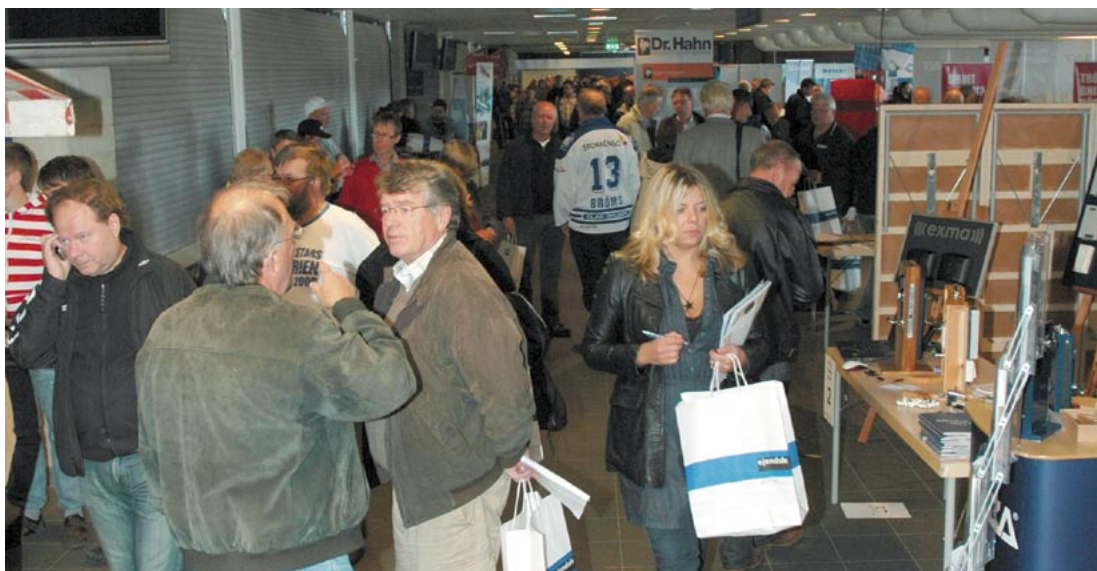
Det var folkligt och festligt bland montrarna under Mötesarenan.

Mötesarenan växer och blir alltmer givande, för alla inblandade. Det kan konstateras efter årets mässa, som hölls den 17 september i Ejendals Arena. Drygt 500 gäster och samarbetspartners deltog för att under en dag få veta mer om produktnyheter, träffa kollegor samt underhållas och njuta av både middag och ishockey.